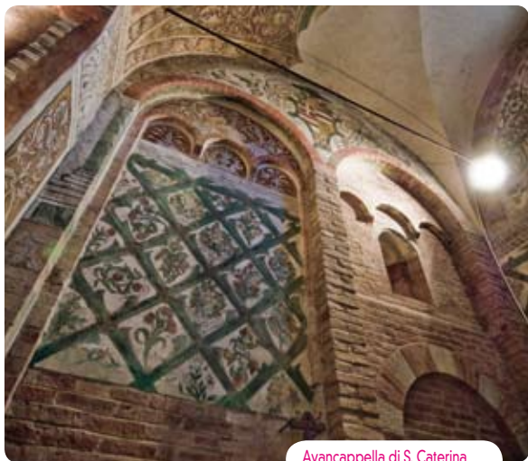
Avancappella di S. Caterina

■ Pur essendo ridotto all'ultima campata ed alla zona absidale, il vano ecclesiale ha conservato l'originaria partizione basilicale in tre navate. Il sobrio aspetto in mattoni e copertura a travi e travicelli dipinti, è esito degli interventi di recupero stilistico dovuti al restauro tardo ottocentesco di Achille Sammarini. Un tempo le superfici erano intonacate e ricoperte di splendenti decorazioni pittoriche. I resti di questi affreschi si scorgono nella navata centrale. Sull'arco trionfale è la Maiestas Domini , e l'Annunciazione; nell'abside, è ben conservata, l'Adorazione dei Magi. Nella parte alta delle murature le Scene del Nuovo Testamento. Partendo da destra, si riconoscono la Fuga in Egitto, la Strage degli Innocenti, l'Agnello Mistico, tracce delle Nozze di Cana, per interrompersi con l'avvenuta distruzione cinquecentesca della chiesa e la chiusura della nuova facciata. Proseguendo a sinistra, è la Traditio legis , l'Incredulità di Tommaso, l'Ascensione, la Pentecoste e, verso l'attacco absidale, la Cena di Emmaus. Si tratta di eccezionale ciclo pittorico, di qualità molto alta, raro per ampiezza delle superfici superstiti, dovuto ad artista padano con influenze bizantineggianti, da assegnarsi alla fine del XII.