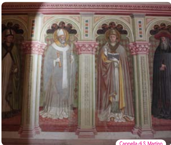
Cappella di S. Martino

Dell'originaria chiesa, tra VIII e IX secolo, non restano strutture visibili, tranne tracce di cripta rilevate negli scavi intrapresi nel 1983, mentre è accertata l'esistenza sul luogo dove venne costruita, di fondazioni appartenenti ad edificio di epoca tardo romana, probabilmente una domus rustica, testimonianza preziosa che si riallaccia all'origine dell'iniziale nucleo abitato di Carpi. Le parti superstiti di architettura romanica appartengono alla ricostruzione avviata, tra il primo