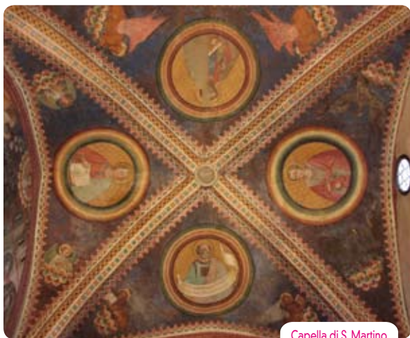
Capella di S. Martino