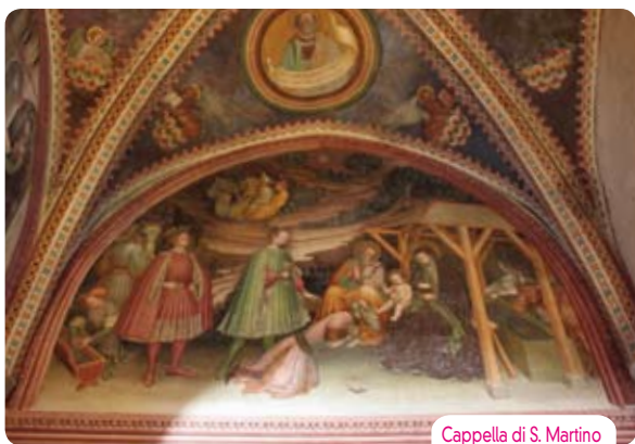
Cappella di S. Martino

L'altare maggiore è opera moderna del 1909, eseguito in stile medievale. Sul lato destro dell'abside si trova il rilievo in terracotta dell'Assunzione di Maria sostenuta da due Angeli, resto di dossale d'altare, opera di bottega toscana del primo Quattrocento. Nella parete di facciata è addossato l'ambone, composto nel 1606 per la nuova chiesa collegiata e qui riportato con i restauri del Sammarini. Opera assai importante del XII secolo, utilizza lastre scolpite in marmo greco provenienti dall'antica recinzione presbiteriale della pieve ed è dovuto a Nicolò, artista operoso con Wiligelmo nel cantiere del Duomo modenese. Con potente plasticismo sono raffigurati i simboli degli Evangelisti: il toro, l'aquila, il leone, l'angelo, oltre una figura assorta di Profeta. Nella navata destra è collocato il marmoreo sarcofago di Manfredo Pio, primo signore di Carpi, eseguito nel 1351 dal bolognese Sibellino da Caprara.