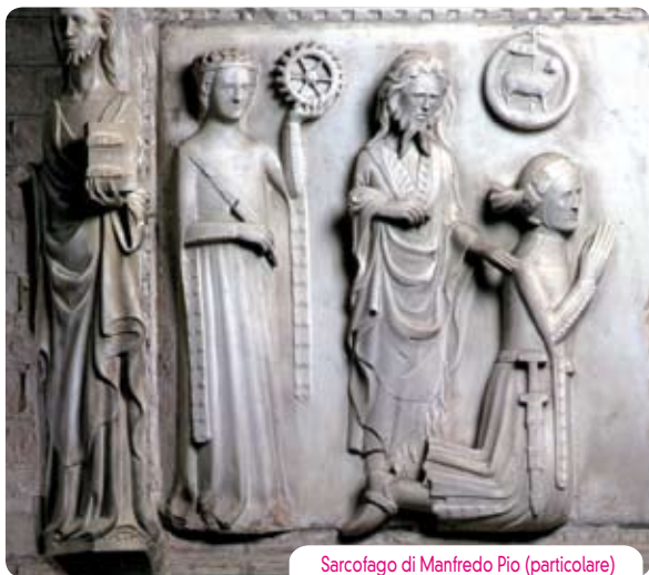
Sarcofago di Manfredino Pio (particolare)