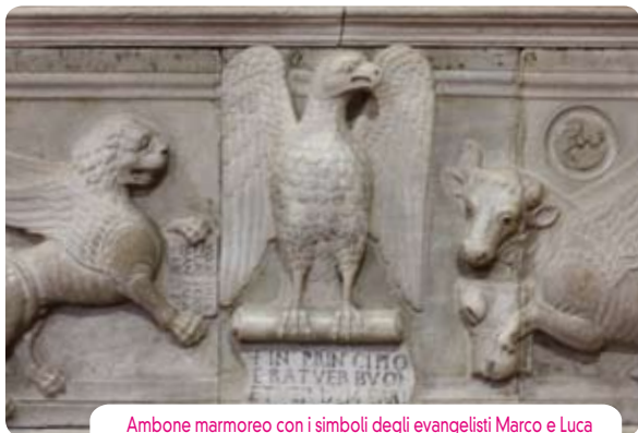
Ambone marmoreo con i simboli degli evangelisti Marco e Luca

membrature ad arcate cieche con suddivisione di archetti su peducci in continuità con quanto rimane all'esterno. Il vano, considerato come atrio porta alla CAPPELLA DI SANTA CATERINA D'ALESSANDRIA. È voltato a crociera e le pareti sono decorate in modo illusionistico da finto pergolato costituito dall'intreccio di rami recisi dove sono cespi di fiori ed un gallo, quest'ultimo simbolo del trascorrere del tempo. Riquadri a candelabra nelle pareti e negli spicchi della volta circondano medaglioni con stemmi dei Pio recanti cappello prelatizio con riferimento al commendatario Galeotto Pio, arciprete di Carpi nella seconda metà del XV secolo.