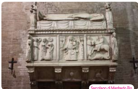
Sarcofago di Manfred Pio

minore. Ha volta a crociera costolonata ed in origine si mostrava interamente affrescata; ora la decorazione è superstite nell'arco trionfale, nella parete sinistra e nella volta dovuta al raffinato pittore ferrarese Antonio Alberti, artista appartenente alla corrente del gotico internazionale, realizzata verso il 1424. Nel pilastro di ingresso, a sinistra sono le figure di San Giacomo Maggiore e di San Cristoforo e, parzialmente nel volto, entro schemi quadrilobati, i busti delle Sante Lucia, Agnese, Flora. Nell'intradosso è l'Annunciazione, mentre nella lunetta a sinistra l'Adorazione dei Magi e, sottostante, entro finta architettura prospettica di nicchie polilobate, le austere figure dei Santi Agostino, Ambrogio, Gregorio, Girolamo. La volta, dipinta a cielo con stelle dorate, ha nei medaglioni gli Evangelisti con i rispettivi