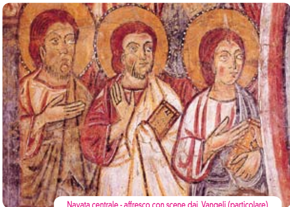
Navata centrale - affresco con scene dai Vangeli (particolare)

minore. Ha volta a crociera costolonata ed in origine si mostrava interamente affrescata; ora la decorazione è superstite nell'arco trionfale, nella parete sinistra e nella volta dovuta al raffinato pittore ferrarese Antonio Alberti, artista appartenente alla corrente del gotico internazionale, realizzata verso il 1424. Nel pilastro di ingresso, a sinistra sono le figure di San Giacomo Maggiore e di San Cristoforo e, parzialmente nel volto, entro schemi quadrilobati, i busti delle Sante Lucia, Agnese, Flora. Nell'intradosso è l'Annunciazione, mentre nella lunetta a sinistra l'Adorazione dei Magi e, sottostante, entro finta architettura prospettica di nicchie polilobate, le austere figure dei Santi Agostino, Ambrogio, Gregorio, Girolamo. La volta, dipinta a cielo con stelle dorate, ha nei medaglioni gli Evangelisti con i rispettivi