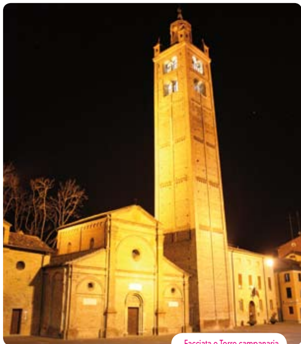
Facciata e Torre campanaria

La conseguenza più evidente di questi fatti fu la decisione avviata nel 1514 da parte di Alberto III Pio di abbattere gran parte del vetusto edificio lasciando la zona absidale, trasformata in oratorio. Le prerogative ecclesiali vengono attribuite alla superba chiesa collegiata, poi cattedrale dell'Assunta, eretta sulla grande piazza di Borgogioioso,