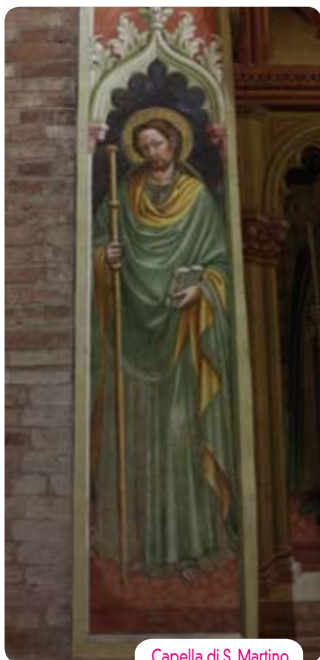
Capella di S. Martino

Nella corrispettiva di destra, Caterina viene decapitata in carcere ed il Trasporto del corpo sul Sinai da parte degli Angeli. Nella volta, su fondo di cielo azzurro a stelle, i medaglioni con l'Eterno Padre e gli Arcangeli Michele, Raffaele, Gabriele, oltre animali simbolici degli Evangelisti. Da menzionare, all'altare il paliotto in scagliola del XVIII secolo con l'immagine di San Nicola da Tolentino, manufatto proveniente dalla distrutta chiesa dedicata a questo santo.