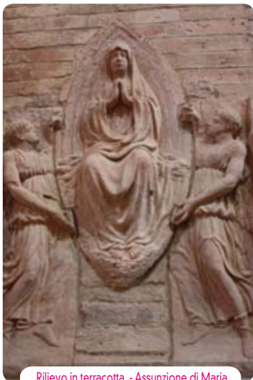
Rilievo in terracotta - Assunzione di Maria

Dalla piccola porta sulla navata sinistra, si passa in un ambiente addossato nel XV secolo alla parete esterna settentrionale della pieve, di cui si notano le